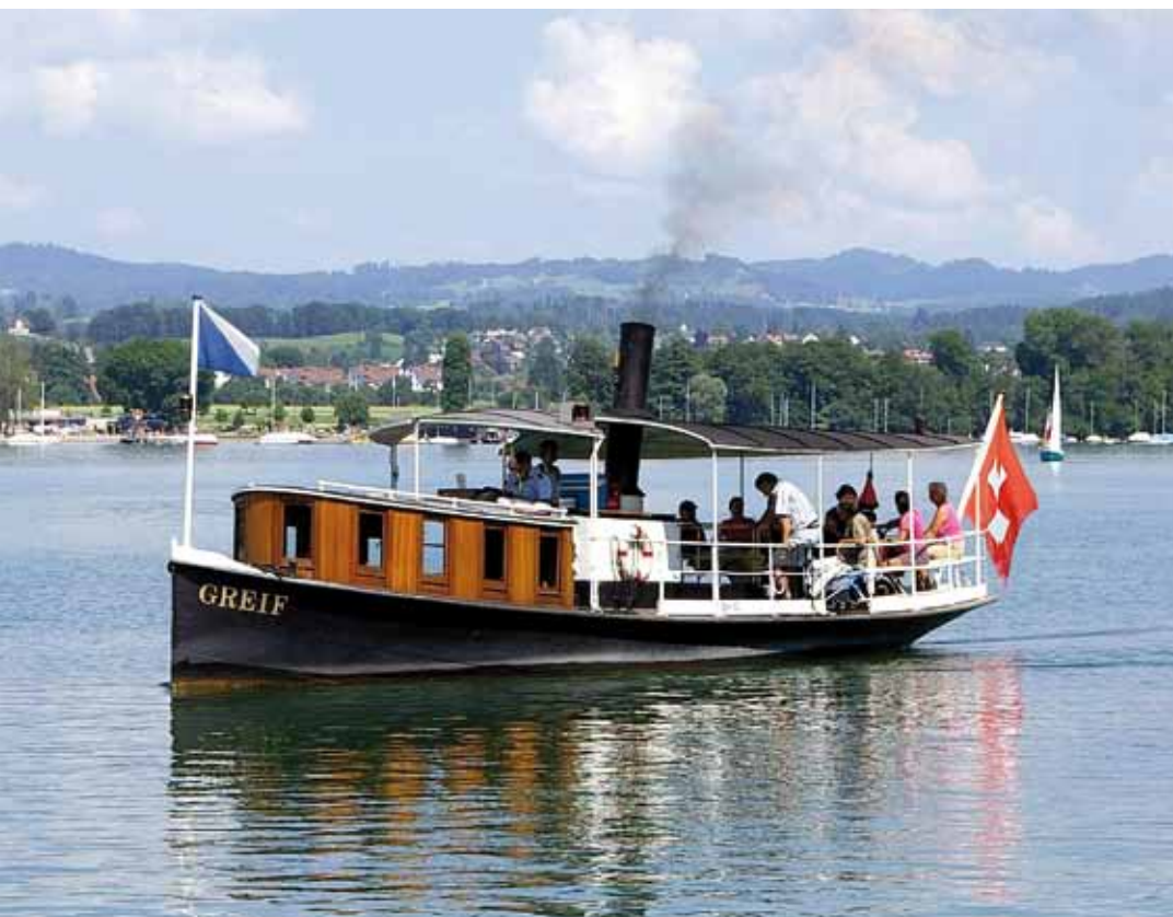
Das in den Jahren 1986 bis 1988 nach den Originalplänen restaurierte Dampfschiff Greif begeistert bereits beim Anblick immer wieder von Neuem.

Das Schiff und die Maschine befinden sich nach wie vor in einem tadellosen Zustand. Das Dampfschiff Greif hat bis heute seinen festen Platz im Angebot der Greifensee-Schifffahrt. Seine weit herum hörbare Dampfpfeife gehört ganz einfach zur Greifensee-Landschaft. Das restaurierte Dampfschiff ist dabei nicht in erster Linie eine nostalgische Attraktion, sondern gilt viel mehr als ein bedeutender Zeuge des damaligen industriellen Zeitalters. Eine Begegnung mit diesem originellen und sowohl verkehrstechnisch als auch historisch interessanten Objekt erfreut jederman, jung und alt.