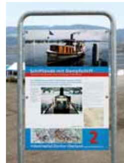
Das Dampfschiff Greif ist Teil des Industrielehrpfads Zürcher Oberland.

Reservierungen werden ausschliesslich für individuelle Fahrten entgegengenommen. Die Fahrzeiten sowie weitere Informationen über die Greifensee-Schiffahrt finden Sie in der Broschüre der SGG, erhältlich bei der Geschäftsstelle in Maur oder auf www.sgg-greifensee.ch .