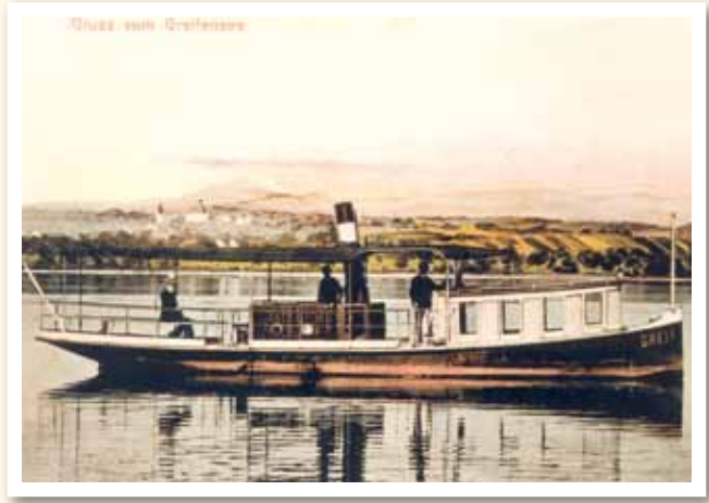
Die Aufnahme für diese kolorierte Postkarte wurde in der Zeit vor 1916 gemacht.

Das 1895 in Zürich für den Greifensee erbaute Dampfschiff Greif wurde im Jahr 1916 zum Motorschiff umgebaut. Das zufällige Auffinden der originalen Dampfmaschine im Jahr 1979 führte 1983 zur Gründung einer Stiftung mit dem Ziel, das Schiff wieder in seinen ursprünglichen Zustand zurückzusetzen und dessen Betrieb sicherzustellen. In den Jahren 1986 bis 1988 wurde die «Greif» nach den Originalplänen restauriert und wieder mit der ursprünglichen Dampfmaschine ausgerüstet. In der öffentlichen Personenschiffahrt ist das Dampfschiff Greif nicht nur das älteste Dampfschiff der Schweiz, sondern auch das einzige mit Schraubenantrieb und zudem das einzige, das mit Kohle befeuert wird. Es ist Eigentum der Stiftung zum Betrieb des Dampfschiffes Greif.