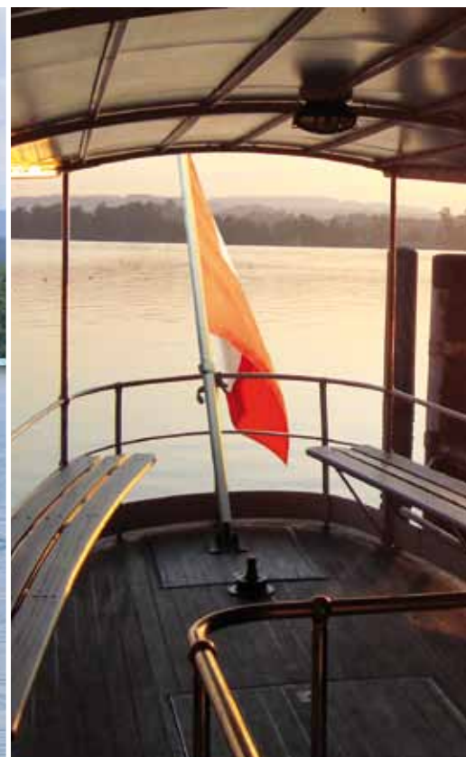
Das luftige und einladend wirkende Achterschiff.