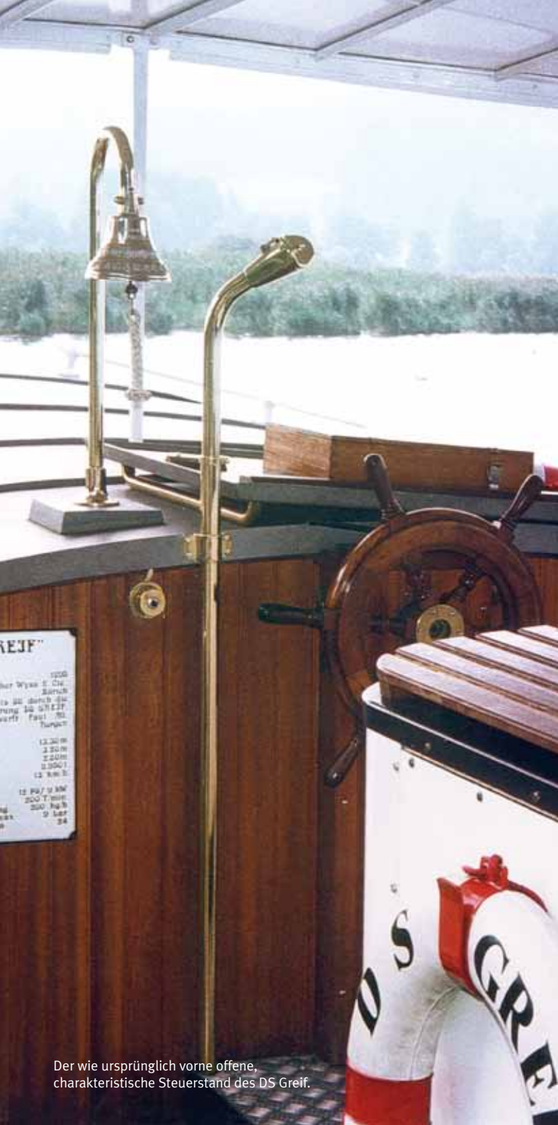
Der wie ursprünglich vorne offene, charakteristische Steuerstand des DS Greif.